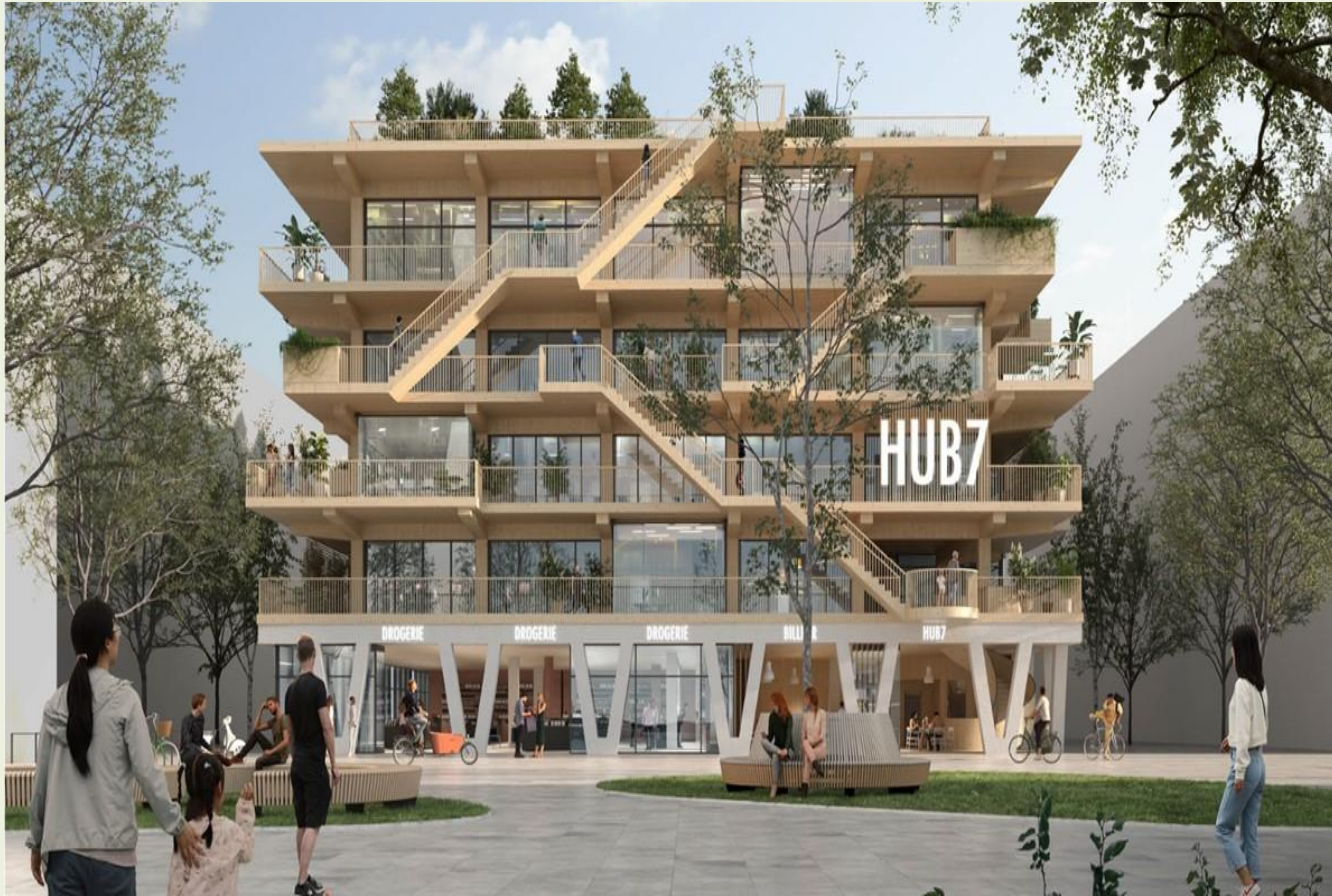
Rendering von KPW Papay Warncke Vagt Architekten PartG mbH